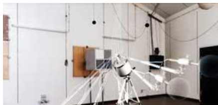
ŘEŠENÍ NA TLUMIČÍCH HLUKU KUSTIKA