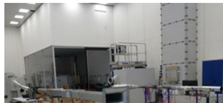
ZKUŠEBNÍ ZAŘÍZENÍ REGULAČNÍ TECHNIKA