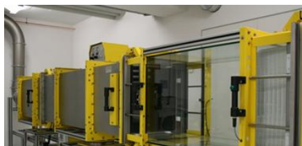
ŘEŠENÍ PRO NEJNÁROČNĚJŠÍ POŽADAVK